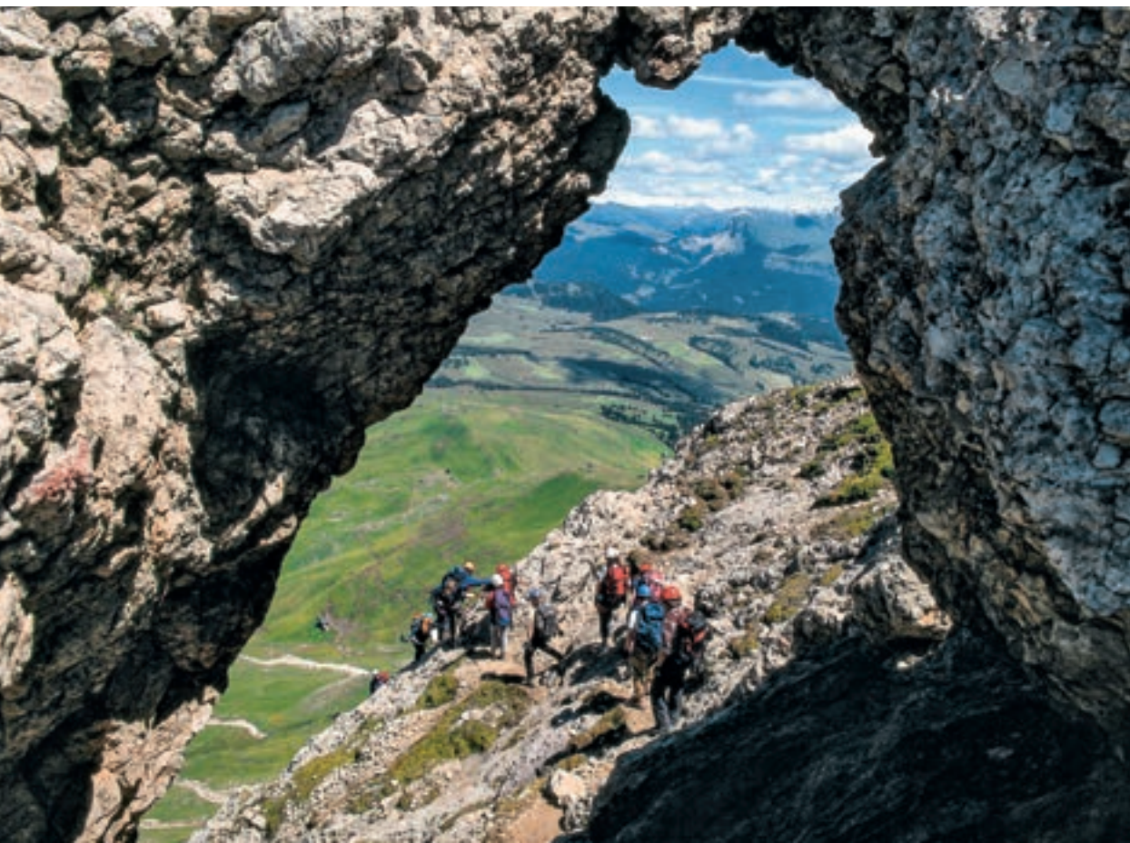
Ponte di roccia sulla Via Ferrata Maximilian