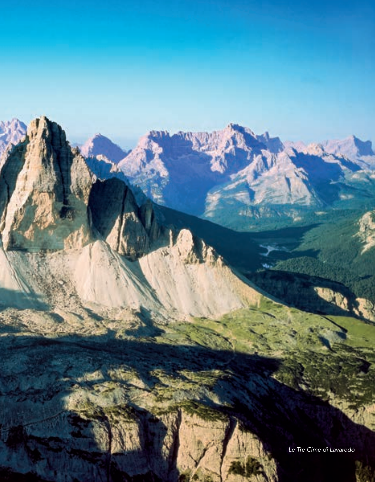
Le Tre Cime di Lavaredo