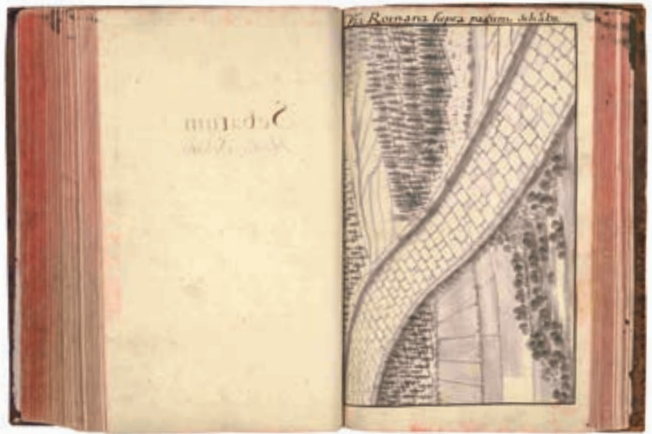
Abb. 2: Die »Römerstraße« bei Schabs, die Roschmann als Erster dokumentiert hat. Handschrift des Ferdinandeum Dip. 1333.

diesem Thema eine erste Anregung in Schloss Ambras, gab bzw. gibt es doch dort eine Sammlung von römischen Meilensteinen. 37 Deshalb widmet Roschmann diesem Thema in seinem Hauptwerk, den sogenannten Inscriptiones (siehe unten), jeweils sehr umfangreiche Abschnitte. 38 Die Existenz von Meilensteinen nahm Roschmann zum Anlass, sich mit Fragen der römischen Topographie zu befassen, um damit Bausteine für eine Landkarte des antiken Tirol 39 zu erhalten. Tatsächlich ließ Roschmann eine solche Karte verfertigen, die er seinem – unveröffentlicht gebliebenen – Geschichtswerk Prodromus (»Voruntersuchung«) beigab. 40 Dass Roschmann bei der Identifikation antiker Namen mitunter danebengriff (wie etwa im Falle von Lienz = Loncium oder Tirol = Teriolis ), schmälert die grundsätzliche Bedeutung seiner Überlegungen zu topographischen Fragen nicht. 41