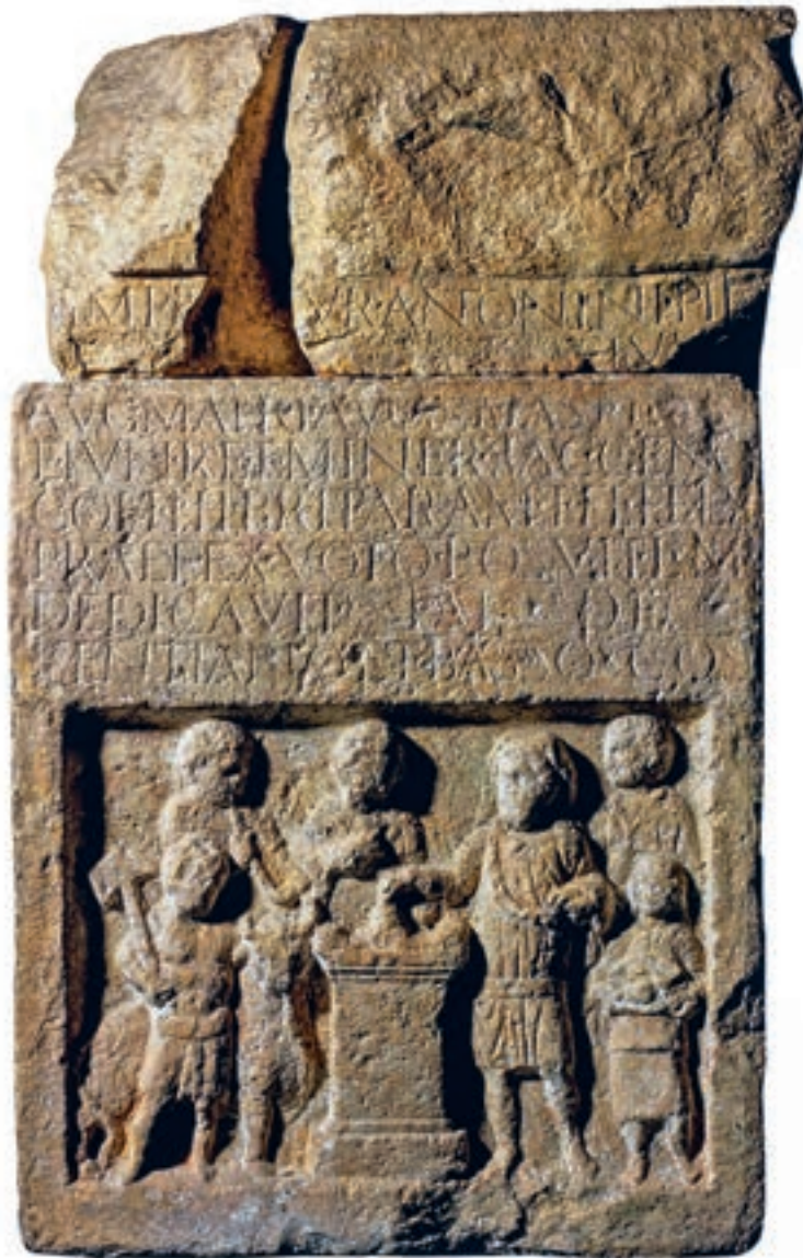
Abb. 2: Weihealtar aus Eining, Lkr. Kelheim, zu Ehren des severischen Kaiserhauses, der kapitolinischen Trias und des Genius der cohors III Britannorum vom 1. Dezember 211 n. Chr. Unter der Inschrift Opferszene mit Truppenpräfekt rechts vom Altar sowie Opferpersonal. Abguss des im zweiten Weltkrieg zerstörten Originalsteines, Archäologische Staatssammlung München (© Archäologische Staatssammlung München, Stefanie Friedrich).

Umgebung, bald aber auf allen in Bayern unternommenen Reisen suchte er nach vermauerten römischen Inschriftensteinen. Diese schrieb er vor Ort zunächst sorgfältig ab und übertrug die Texte 1511 zeilengetreu und in Reinschrift in einen dafür angelegten Sammelband, 5 der im Anschluss den Text der sogenannten »Kleinen Annalen« enthielt, eine Landeschronik Bayerns vom 6. Jahrhundert bis 1463. 6 Unter den Rubriken Vetustates Romanae a Ioan. Aventino inventae in Vindelicis quae nunc est Bavaria sowie Vetustates Romanae a Ioan. Aventino inventae in Norico sind die Abschriften der römischen Inschriftentexte gewissenhaft nach der Herkunft vom Boden der Provinzen Raetien (als »Vindelicum« bezeichnet) bzw. Noricum geordnet. Dabei schenkte Aventin fast ausschließlich den Inschriften selbst seine Aufmerksamkeit, während er die Form der Denkmäler, Verzierungen und Rahmungen vernachlässigte. Eine Ausnahme bildet nur der zu Ehren des severischen Kaiserhauses und der kapitolinischen Trias errichtete Altar aus Eining, Lkr. Kelheim (Abb. 2). Dessen ungewöhnliche Reliefs gibt Aventin in Abzeichnung wieder. 7 Bemerkenswert ist dabei, wie frei er im Gegensatz zu den exakt kopierten Inschriften mit verschiedenen Elementen der Darstellung