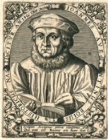
Abb. 1: Johannes Turmair, genannt Aventinus (1477–1534). Kupferstich aus: Theodor de Bry, Icones quinquaginta virorum illustrium doctrina & eruditione praestantium ad vivum effictae, cum eorum vitis descriptis (Frankfurt 1597).

Glück, die Einheit seines lange durch Erbteilung gespaltenen Landes wieder herzustellen. Als der Herzog 1508 starb, hinterließ er drei unmündige Söhne. Nach dem von ihm selbst verfügten Primogeniturgesetz sollte nur der älteste, Wilhelm, das Herzogsamt übernehmen. Für die beiden jüngeren Brüder Ludwig und Ernst sah der eingesetzte Regentenrat eine gründliche humanistische Ausbildung in den Wissenschaften und Künsten vor, wie sie an den Fürstenhöfen der Renaissance in Mode gekommen war. Hierzu erging der Ruf als Lehrmeister an den damals 31-jährigen Johannes Turmair aus Abensberg, der sich nach seiner Heimatstadt latinisierend selbst Aventinus nannte (Abb. 1).