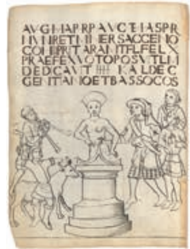
Abb. 3: Abschrift der Inschrift des Eininger Weihealtars und zeichnerische Wiedergabe der Opferszene durch Aventin, der den Stein 1507 gesehen hat. Die Figuren werden in zeitgenössischer Kleidung des 16. Jahrhunderts dargestellt, manche Details der Darstellung sind missverstanden.

Der weitere Weg führte über Bozen und den Eisack aufwärts. In Blumau registrierte er einen Meilenstein mit Inschrift für Kaiser Maxentius (307–312 n. Chr.). Dieser war nicht lange zuvor auf Befehl von Kaiser Maximilian I. gesichert und an