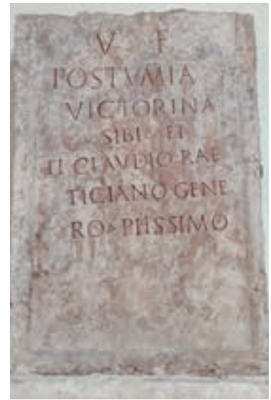
Abb. 9: Grabstein der Postumia Victorina und ihres Schwagers Claudius Raeticianus. Eingemauert in der Nordwand der Pfarrkirche Unserer Lieben Frau in Sterzing.