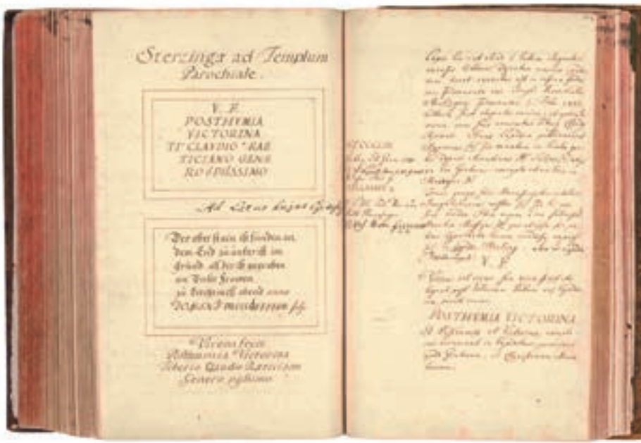
Abb. 3: Die Grabinschrift der Postumia in der Pfarrkirche von Sterzing und die spätgotische Inschrift, die über die Auffindung im Jahre 1497 berichtet. Handschrift des Ferdinandeum Dip. 1333.

für die darüber liegenden Mosaiken. 46 Die Exaktheit dieses Plans ermöglichte übrigens rund 250 Jahre später eine erfolgreiche Nachgrabung durch die Universität Innsbruck. 47