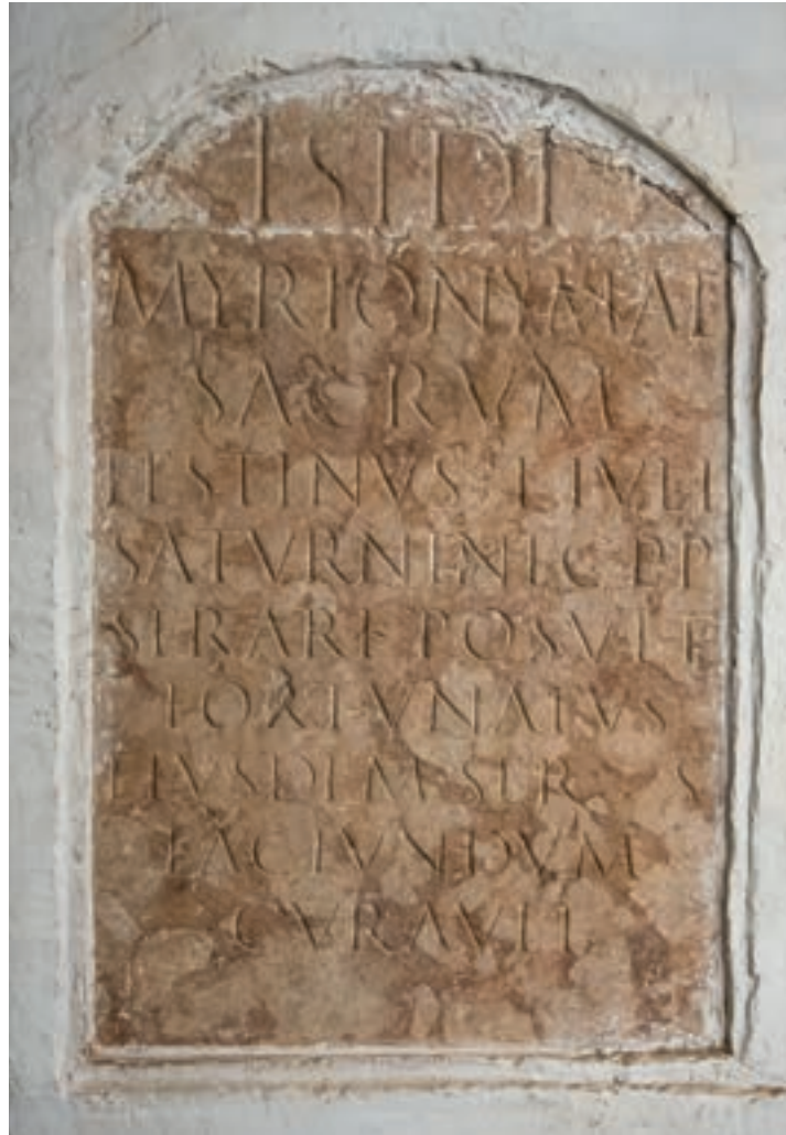
Abb. 6: Weihstein für Isis Myrionoma, die »vielnamige Isis« aus Waidbruck. Mitte 2. Jh. n. Chr. Der Stein ist seit dem 17. Jahrhundert eingemauert in einem Pfeiler der Treppenanlage im Innenhof der Trostburg.

Existenz römischer Inschriften am Ort berichtet worden – ganz im Gegensatz zu einem anschließend noch zu behandelnden Fall in Sterzing. Dass die eigentliche Auffindung der vier Steine und deren Verwahrung bei St. Jodok aber schon länger zurückliegen musste, wird aus der Bemerkung Aventins deutlich, wonach jetzt nur noch einer dort vorhanden sei. Möglicherweise kamen die Denkmäler schon bei Errichtung der Kirche um 1330 zum Vorschein – wofür auch die Verbauung mindestens eines Steines im Altar der Kirche sprechen könnte – oder bei späteren Bauarbeiten in deren Umfeld. 23