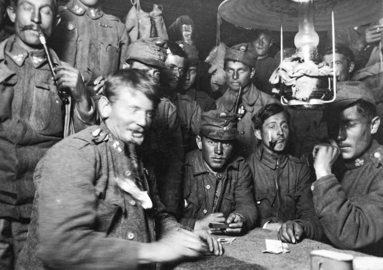
Un'immagine che parla da sola: la truppa nella baracca-caserma dell'Ortles.

questi vengono completamente abbandonati al loro destino e nessuno va a cercarli. Alla fine del febbraio del 1916, una valanga seppellisce la baracca di Kleinboden. Già nel 1912 la gente del posto avverte invano le autorità militari sulla collocazione completamente sbagliata di quella baracca. E infatti, una valanga di neve bagnata sorprende i soldati mentre stanno giocando a carte. Quattro vengono schiacciati dal pesante tavolo di legno, altri muoiono soffocati dai fumi della stufa che continua a bruciare sotto la neve. Soltanto uno sopravvive. È in piedi, ha la testa incastrata tra due travi e riesce a muovere un po' soltanto il braccio sinistro. Con uno sforzo indicibile, riesce a