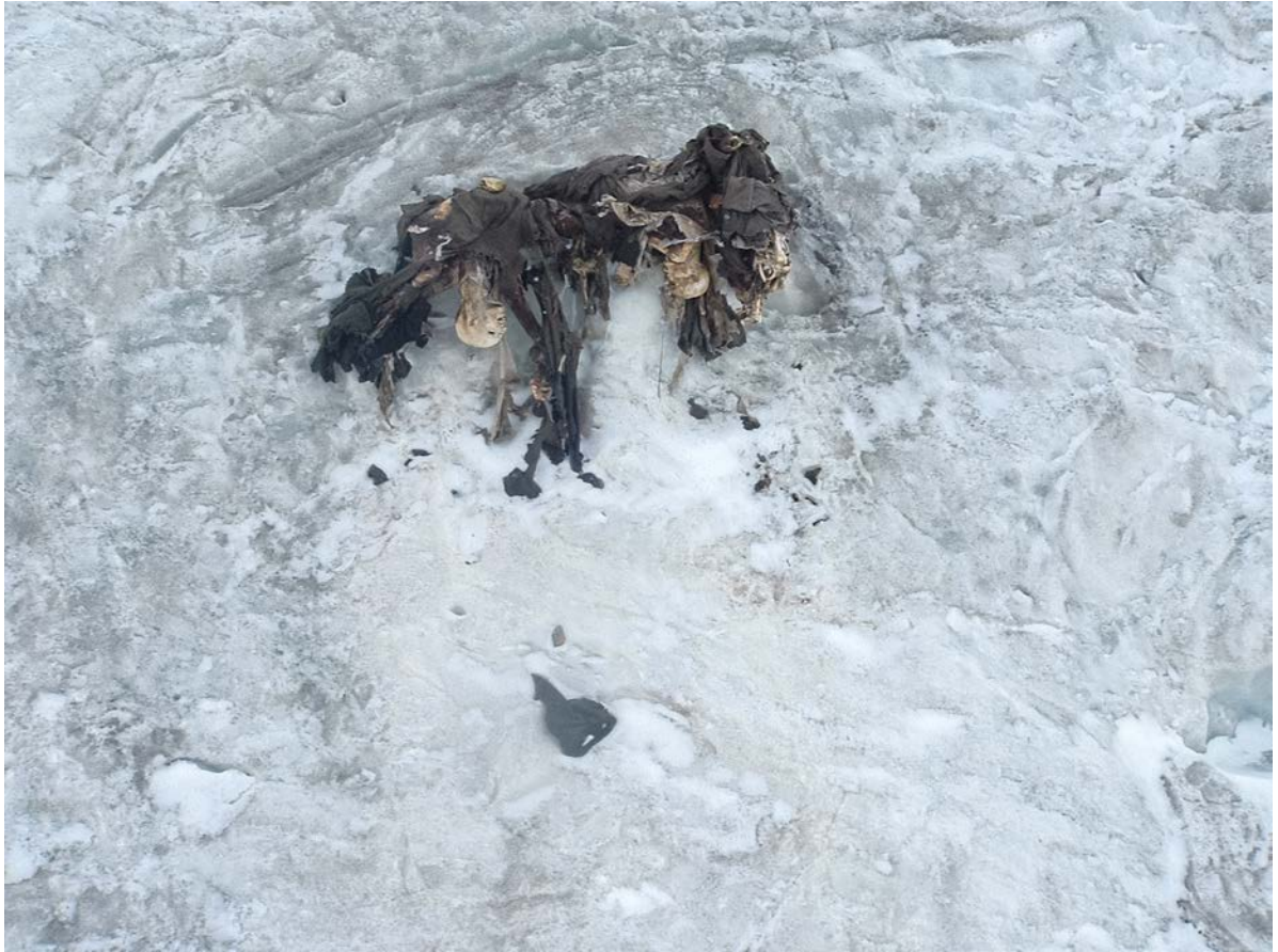
A tu per tu con la morte e il passato. Le mummie glaciali di tre Kaiserschützen conservate nel ghiaccio sul Piz Giumella, emerse nel 2004.