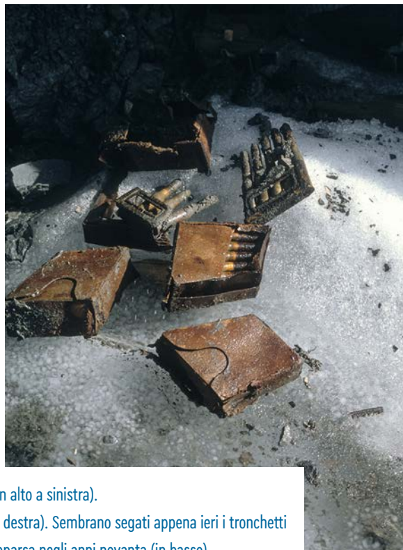
Trincea sulla Punta Madaccio di Dentro nel 1994 (in alto a sinistra). Munizioni per i fucili modello Mannlicher (in alto a destra). Sembrano segati appena ieri i tronchetti di cirmolo davanti a una baracca sul Cevedale riapparsa negli anni novanta (in basso).